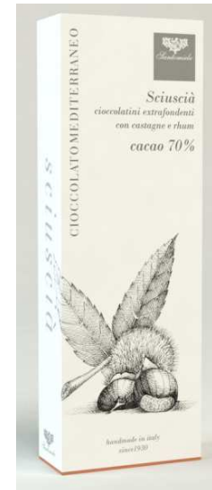
Art. AL7 Gr Sciuscià

Scorzette di limone ricoperte di cioccolato extrafondente e pistacchi di Bronte