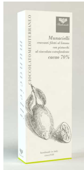
Art. AL3 Gr 50 Munacielli al limone

Scorzette di arance ricoperte di cioccolato extrafondente e nocciole La Tonda di Giffoni