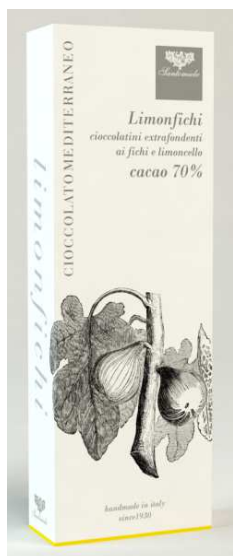
Art. AL6 Gr50 - Limonfichi

Piccoli scrigni di sapori, aromi ed emozioni