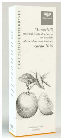
Art. AL2 Gr 50 Munacielli alle arance

Ciocolatini extrafondenti con fichi cultivar dottato e liquore al limoncello